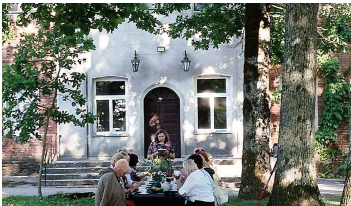
Kuliuose rengiami S.Kymantaitės-Čiurlionienės festivaliai ir ekskursijos su edukacija, į kurias suvažiuoja menininkai ne tik iš Lietuvos, bet ir iš užsienio.

rengiami S.Kymantaitės-Čiurlionienės festivaliai ir ekskursijos su edukacija, į kurias suvažiuoja menininkai ne tik iš Lietuvos, bet ir iš užsienio.