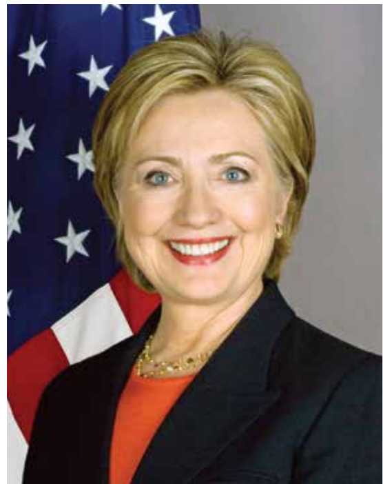
Buvusi Valstybės sekretorė H. Clinton buvo laikoma pagrindine kliūtimi Rusijos siekiams.