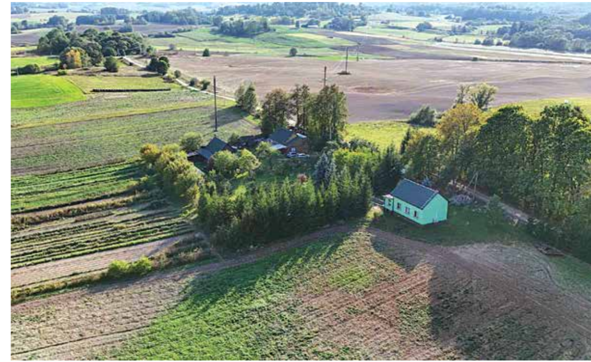
Vaistažolių auginimui Jūratės šeima panaudoja nepilną 1 ha žemės ir tiek užtenka. Ūkio šeimininkė priminė, kad 1 ha vaistažolių ir 1 ha javų – labai skirtingi masteliai.

„Paklausai, susirandi sėklų, pasi-seji, prisiaugini augalų. Taip mūsų augalų, produkcijos asortimentas po