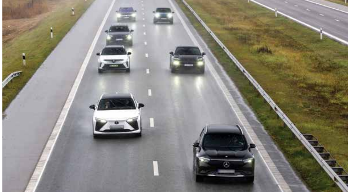
Apibendrinant elektromobilių nuvažiuojamo testo rezultatus, galima drąsiai teigti, jog lietuviškas ruduo nuo kiekvieno žadamo nuvažiuoti 100 km nubraukia didelę dalį.