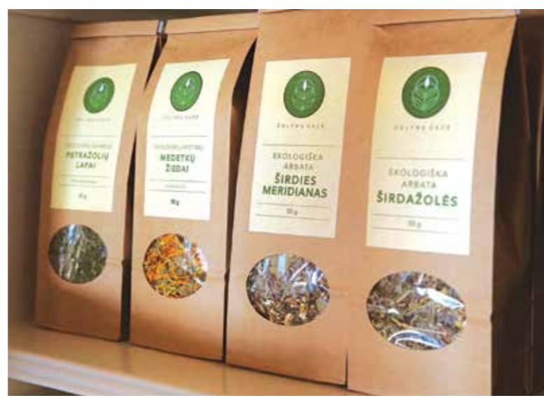
Žolininkė žmonėms rudenį pataria nesigriebti iš karto vaistų, gal pirma išgerti tvariai užaugintų vaistažolių šiltos arbatos puodelį.

Be vaistažolių, prieskoninių augalų gausos, ūkio laukuose auga ir