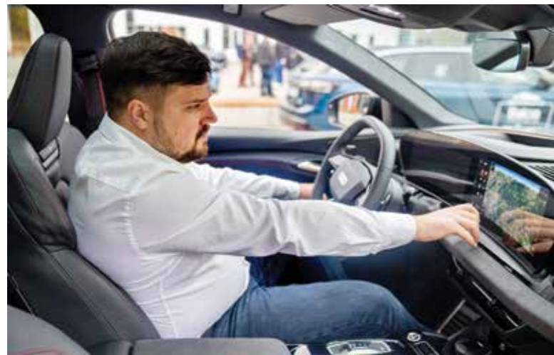
Naujoje nominacijoje vertinamos automobilių interneto galimybės, jo veikimas, integracija su mobiliaisiais įrenginiais bei sistemų naudojimosi patogumas.

Testuojamiems elektromobiliams 200 km atstumą buvo leidžiama įveikti maksimaliu 130 km/h greičiu, tačiau dėl aplinkos sąlygų vidutinis bendras greitis testo metu siekė kiek daugiau nei 90 km/h. Nuspręsta, jog visi vairuotojai važiuos su įjungta patovaus greičio palaikymo sistema, salone veiks klimato kontrolė, taip pat komisijos nariai nevažiuos tyloje ir įsijungs automobiliuose įrengtas multimedijs sistemas.