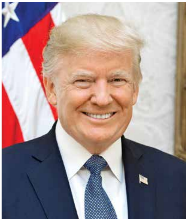
Rusijos platinamose melagienose D.Trumpas buvo vaizduojamas kaip alternatyva „korumpuotam JAV politiniam elitui“.